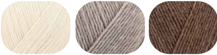
50 g / 150 g natur 01992

R 00033 2 00044 2 00320 4 00324 5 00327 4 00522 2 01047 5 01056 4 01057 3 01062 5 01960 2 01992 1 01994 4 02002 3 02066 5 02070 1 02137 5 02140 1 06046 3 06047 2 06867 3