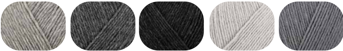
50 g flannell meliert 00033