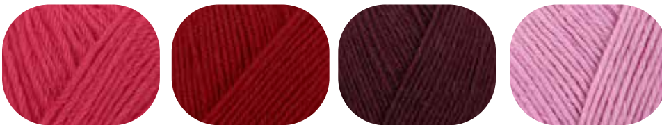
50 g / 150 g azalee 01057