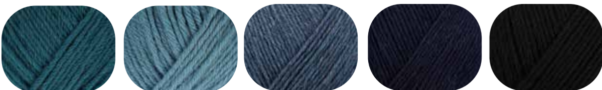
150 g petrol 01047