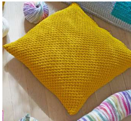
LENNY S11234 | Magazin my home 1