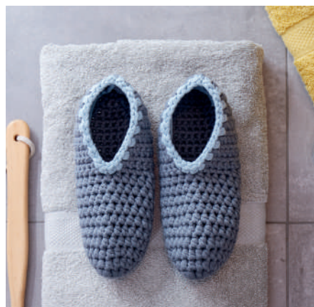
SLIPPER S10230 | Magazin 028 Home Moments