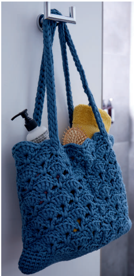
BADETASCHE S10234 | Magazin 028 Home Moments