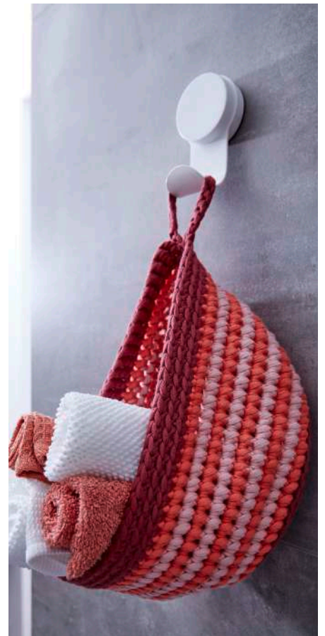
HÄNGEKÖRBCHE S10229 | Webdesign