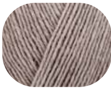
holz meliert 02070