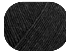
anthrazit meliert 00522