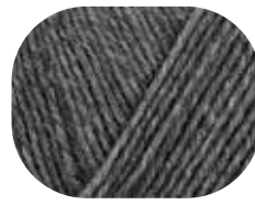
mittelgrau meliert 00044