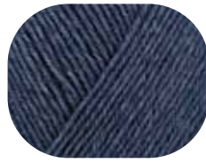
jeans meliert 02137