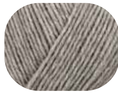
flanell meliert 00033