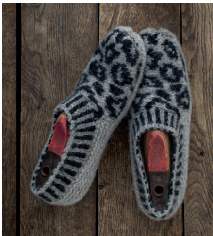
LIVA S10962 | Booklet Wash+Filz-it! Family