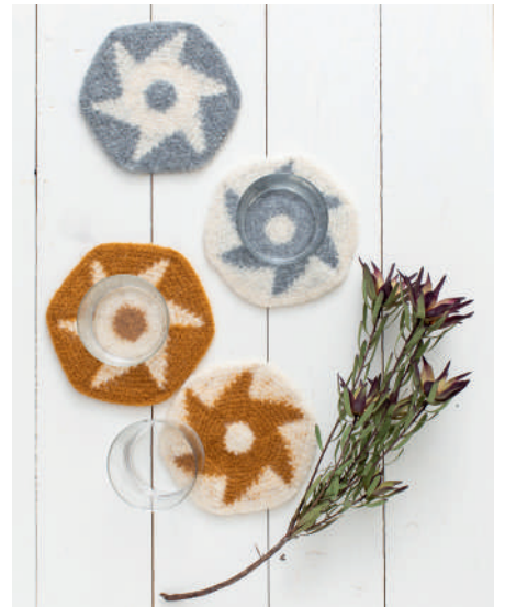
TUVA S10965 | Booklet Wash+Filz-it! Family