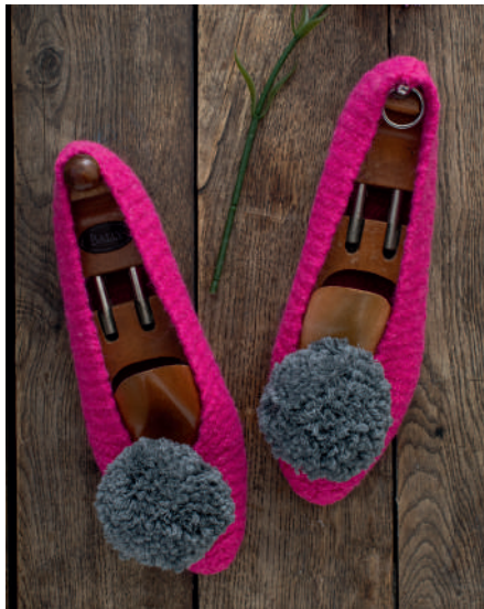
FRIDA S10961 | Booklet Wash+Filz-it! Family