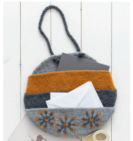
MILO S10964 | Booklet Wash+Filz-it! Family