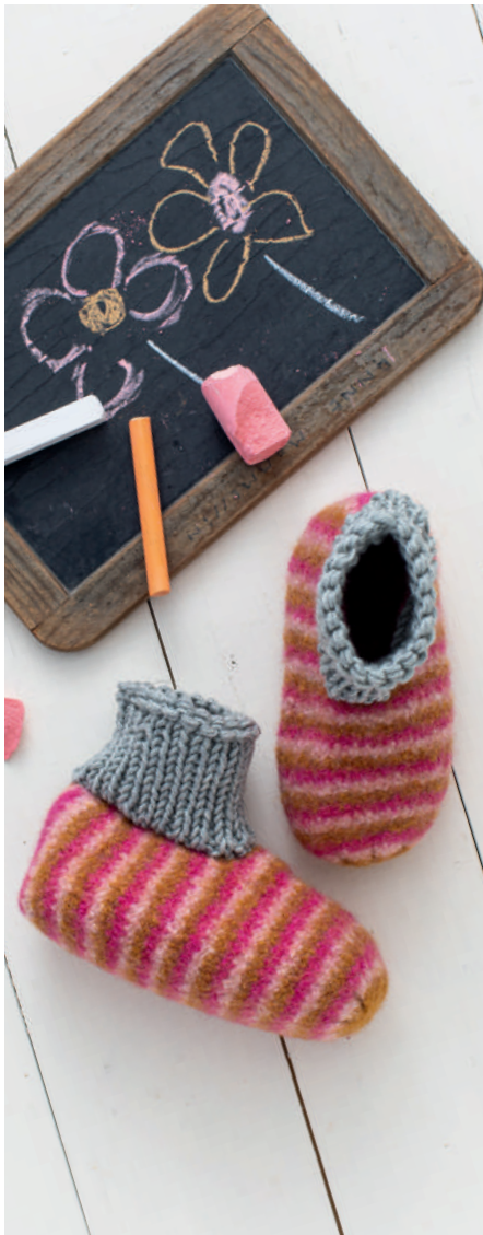
FREYA S10960C | Booklet Wash+Filz-it! Family