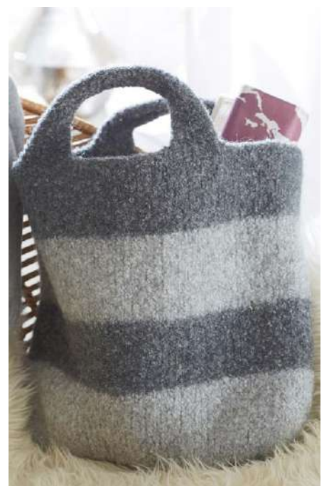
FILZTASCHE 6820 | Webdesign