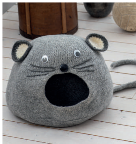
NOVA S10966 | Booklet Wash+Filz-it! Family