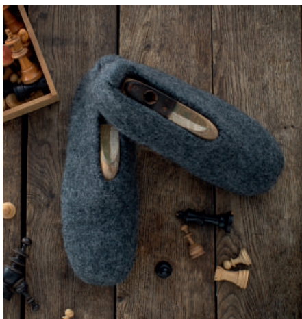
SÖREN S10963B | Booklet Wash+Filz-it! Family