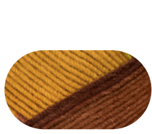
earth color 00096