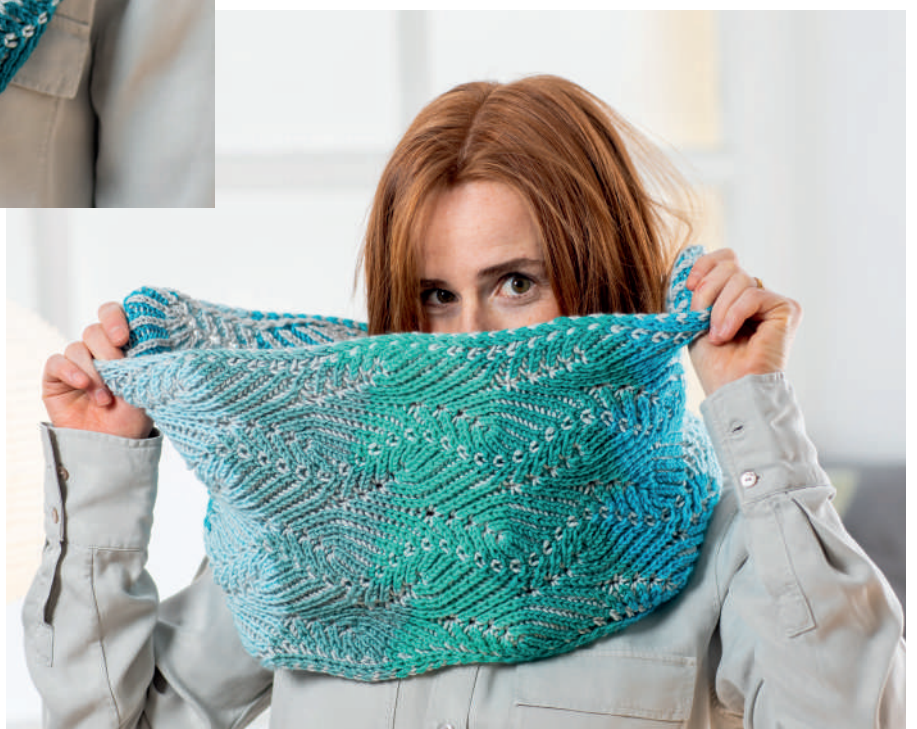
MARLIN S10933 | Booklet Soft & Easy