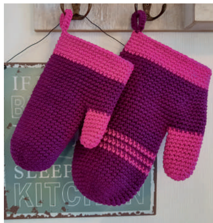
DANI OFENHANDSCHUH S11057 | Booklet Catania Grande Topflappen