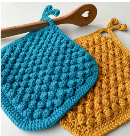
RALPH TOPFLAPPEN S11056 | Booklet Catania Grande Topflappen

29 Farben Colors Coloris Kleuren Färger Farger R 03105 2 03106 1 03110 1 03114 4 03115 3 03128 4 03164 5 03205 6 03207 5 03208 4 03209 6 03210 3 03211 3 03212 2 03213 3 03230 3 03242 1 03248 2 03249 6 03252 3 03254 2 03282 4 03284 5 03380 4 03383 5 03385 5 03392 6 03393 1 03406 2