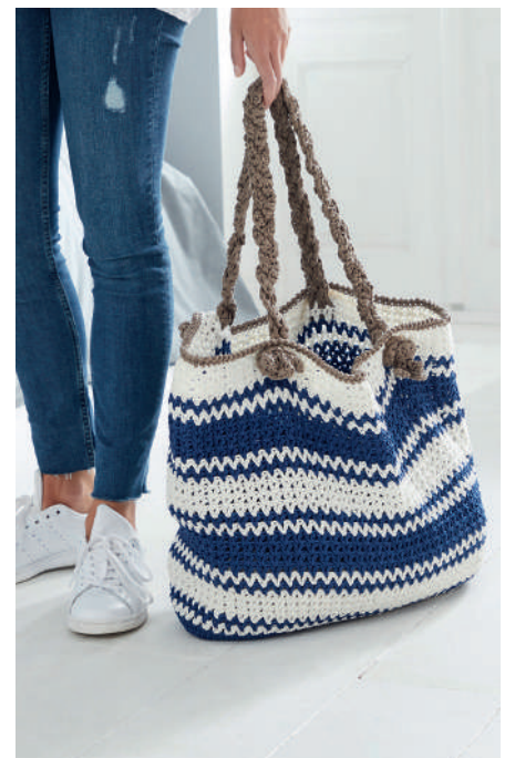
SEA-BYLLE BEACH BAG S10558 | Webdesign