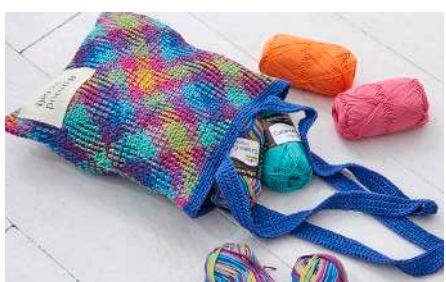
PLANNED POOLING PROJECT BAG S10556A | hello trend Bag it!