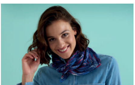
NILA S11316 | Webdesign